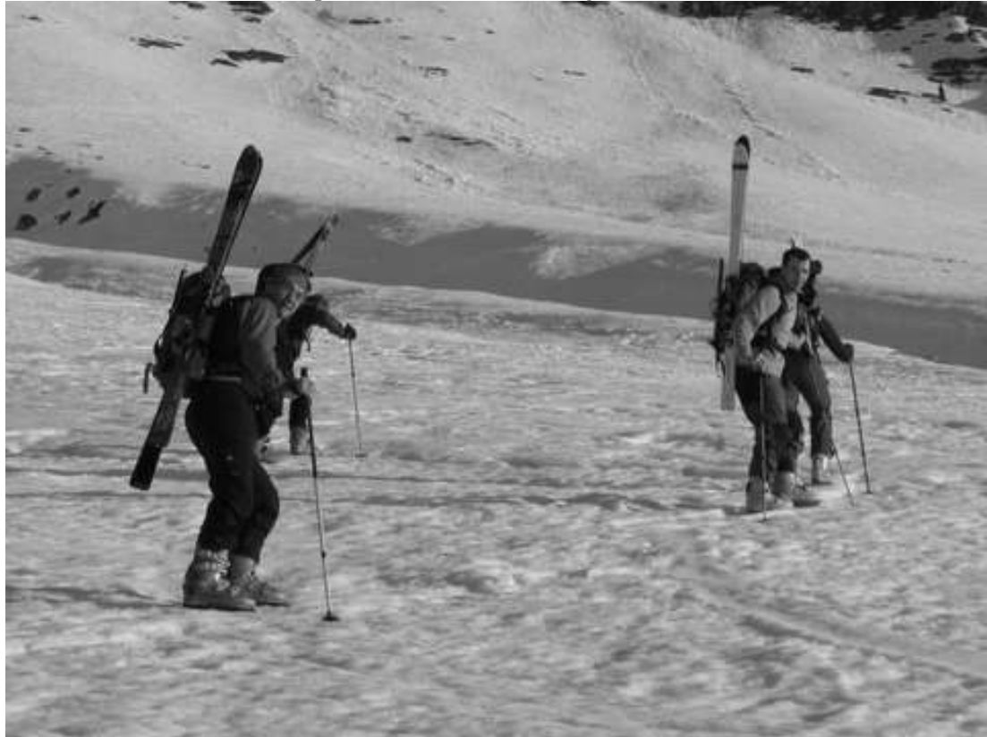
Bovško, goriško, wajdovska naveza se vzpenja na KRN

smo se spustili 100m ob grebenu levo ter od tu nadaljevali smuk v dolino. Sneg je bil v zgornjem delu delno pomrznjen. Skalne skoke pod nami smo obsmučali po desni strani ter se ob srednji grapi spuščali v dolino. Sneg v dolini se je že začel topiti. Smuk je trajal okrog 50 minut. Pogoji za izvedbo ture so bili idealni, tako za vzpon kot tudi sam smuk. Igor Furlan