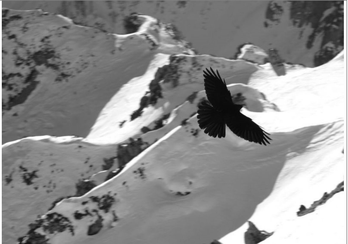
Ali je to nadzornik TNP? Prejšnja fotografija je bila z Mojstrovk.

Izdala: Alpinistična sekcija PD Ajdovščina