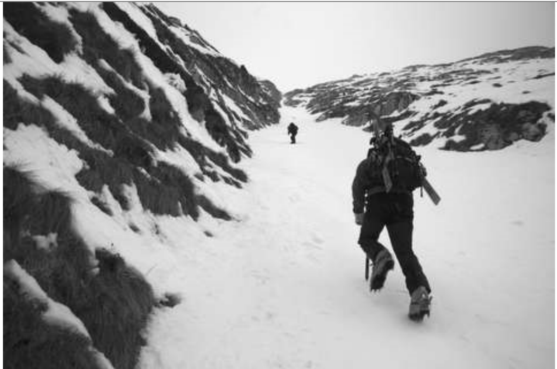
Grapa v Krnu