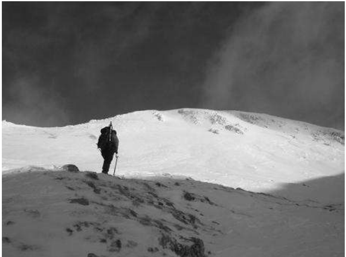
Proti vrhu Stola