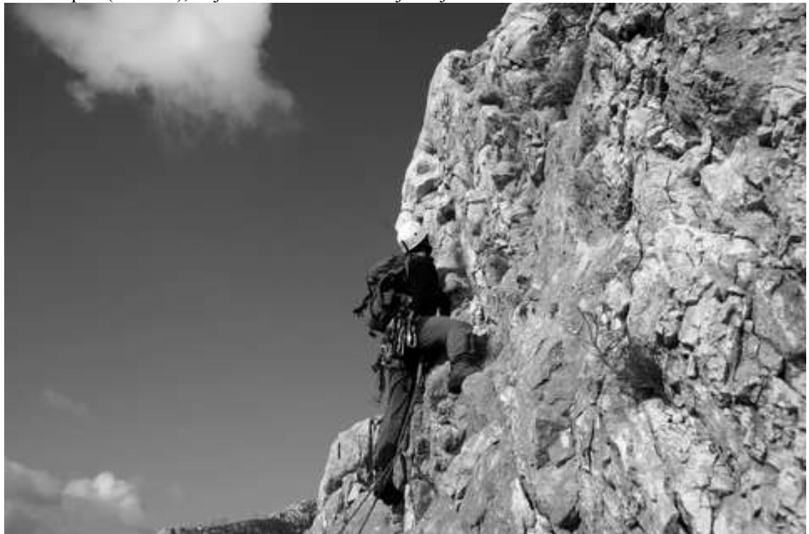
David v začetku 5. raztežaja, detajl IV+

Klavdij in Ožbej sva se prav po turistovsko šele po kosilu (ob 13h) odpravila plezat v Kovk. Klavdij je imel že izbrano zelo centralno linjo v skalovju in pečevju Kovka, ki je obetala lažjo plezarijo (rezultat je bil rahlo drugačen) in spodobno višinsko razliko. Dan je bil lep in sončen. Vstopila sva sredi melišč Kovka, presolirala prvo zelo lahko skalno gmoto in pred naslednjo, ki z malo domišlije ponuja silhueto Triglava, navlekla vso kramo iz nahrbtnika. Čez mestoma krušljiv Triglavček sem naprej splezal Ožbej, Klavdij pa je prevzel v naslednjih dveh zutih, ki sta mestoma ponudila zelo lepo plezarijo. Vseskozi po razu naprej, čez manjšo poč in do pod stenice, ki se nižje konča v grapi levo od najmarkantnejše stene v Kovku. Klavdij je od tu naprej izbral zelo lepo linijo, z dvema težjima deli. Vseskozi so se nama nad glavami podili jadralni padalci, ki so iz zraka spraševali, če ni preveč krušljivo. Prvi detajl sem kot drugi zmožal brez težav v drugem pa vse skupaj zastavil preveč desno, kar me je na koncu prisililo, da sem težave obplezal po desni. Naslednji cug po dobri skali med drevesi skritega raza sem povlekel Ožbej in štantal na drevo. Potem sva se peš spustila nekaj metrov in presenečena obstala pod lepoticco – trideset metrov visoko vertikalno stenico. Klavdij se je nemudoma zapičil in na prvi pogled zaljubil v izrazito poč (cca 8 m), ki je obetala dobro nadaljevanje.